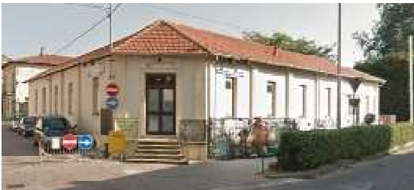
La struttura di 3Effe Market in Via Filzi A Taino, in provincia di Varese.

L'amministrazione e la direzione della societa' compete ai 3 fratelli soci e proprietari, coadiuvati dalla generazione precedente che ha impiantato l'attivita'.